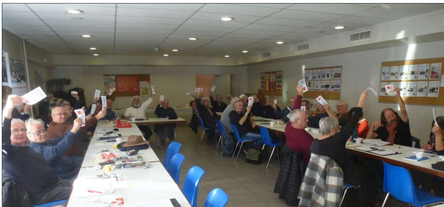
L'Assemblée vote les statuts